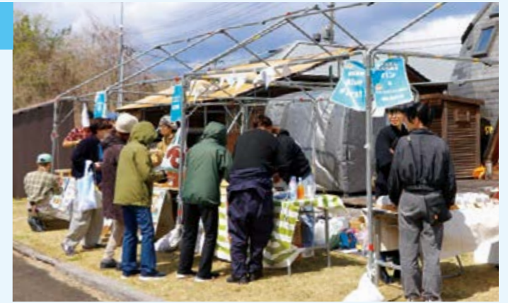
▲協力隊や卒業生のお店も並びます

当日は風が強かったものの天気恵まれ、現協力隊のほか、卒業した元協力隊や、技の匠、飲食店などが集結し、販売や試食、体験ブースなどでお客さんを出迎えました。