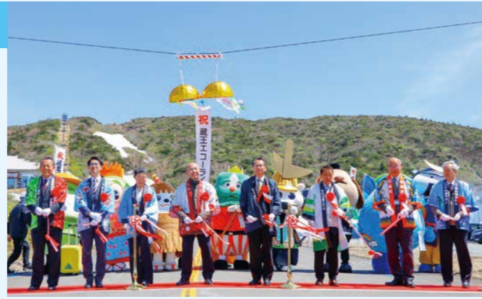
▲ゆるキャラも集合し、記念のテープカット

訪れた方々は、青空の下、お釜の写真や雪の壁を撮影するなどして、5カ月ぶりに開通したエコーラインのドライブを楽しんでいました。