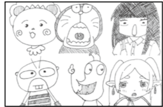
▲ちよんたらぼん (川中)