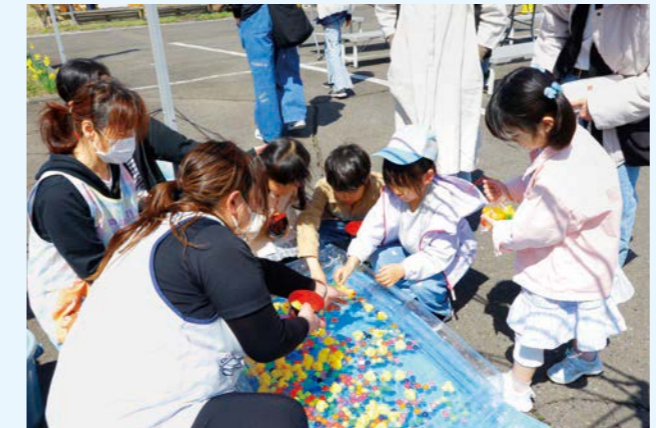
▲縁日コーナーはちびっ子たちに大人気