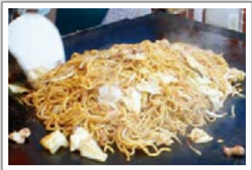
川崎町飲食店組合