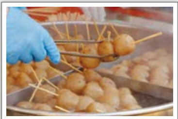
川崎蒟蒻加工組合

日時 6月7日(日) 午前10時から午後3時30分まで 会場 川崎町役場特設会場