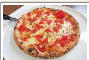
ぱぴハウス川崎店