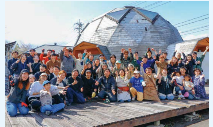
▲協力隊や出店者、スタッフの皆さんお疲れ様でした！