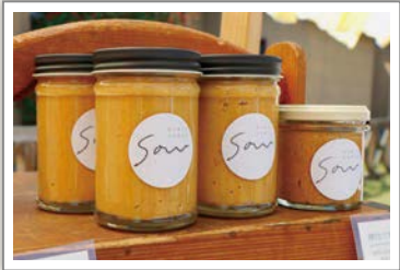
たべることくらすことSOW