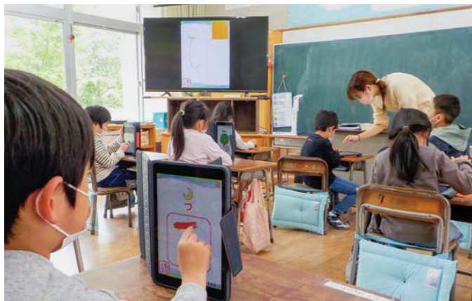
▲タブレットや電子黒板を使用して授業を受ける児童たち

A. 現在の出生数を踏まえると、令和15年前後には町内に小学校1校、中学校1校になると考えています。