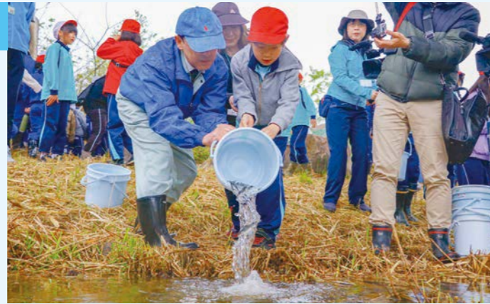
▲ゆっくり優しく川にアユを放流する児童